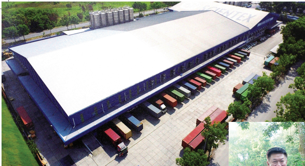
森德位于英达岛（Pulau Indah）的厂房是目前世界前三大单个位置拉伸膜厂房

德集团的总营业额从2001年的1亿7千万令吉，在2018年提升15倍至26亿，为森德带来指数增长，成就非凡，也使森德获得本土、区域甚至是国际企业界的肯定，譬如：2016年获颁马来西亚具有权威指标的“卓越品牌奖”当中的“最具可持续性品牌奖”，赞扬森德作为拉伸膜制造业领航者的地位，林炳仁亦同时获得“品牌精英人物奖”，对他的企业领导给予充分肯定；森德也曾荣登“2015福布斯亚洲中小上市企业200强”之“10亿美元以下最佳企业”排行榜。